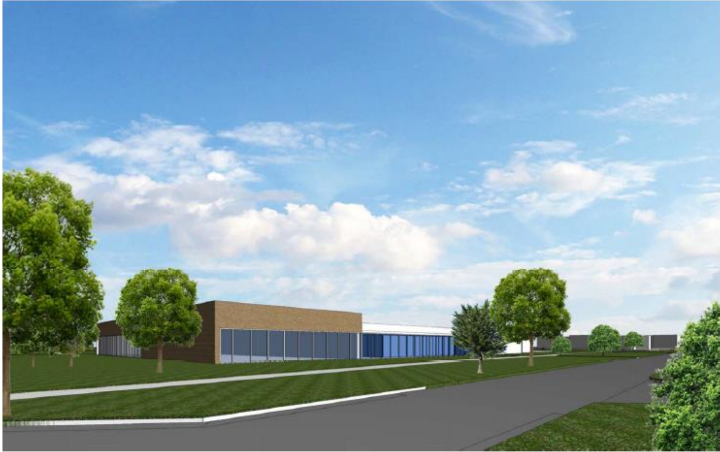
Model A, view Kuipersweg