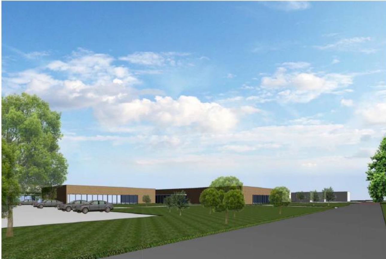
Model B, view Kuipersweg